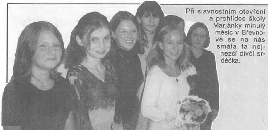
Při slavnostním otevření a prohlídce školy Marjánky minulý měsíc v Břevnově se na nás smála ta nejhezčí dívčí srdečka.