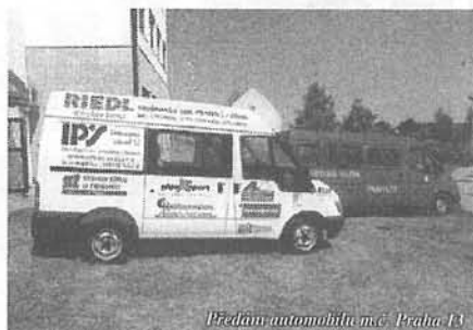
Předání automobilu m.č. Praha 13