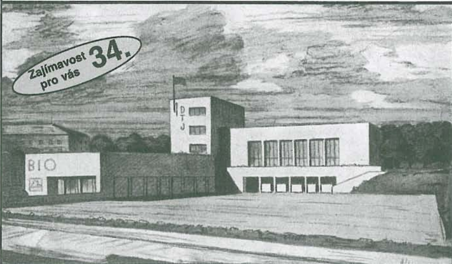
U příležitosti 60. výročí založení sociální demokracie v Břevnově u Kaštanu vydána v r. 1938 pohlednice s textem: Příští stánek strany v Břevnově. Na místě historického hostince vyroste moderní Peckův Lidový dům. Na projektu je vidět plánovaný kinosál a tělocvična DTJ. – Záměr zůstal záměrem.