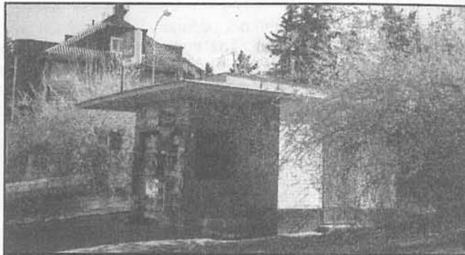
nosné vily. Je totiž dvouúčelová: vpředu je obchod, vzadu transformátor, celý objekt je obložen dlaždičkami. Firma West natřela trafiku na červenou.

Rada také schválila bez výhrad výsledky ročních uzávěrek příspěvkových organizací zřízených městskou částí – Pečovatelství služby, Léčebny dlouhodobě nemocných,