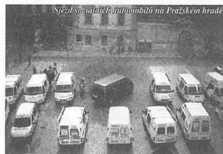
Sjezd sociálních automobilů na Pražském hradeč