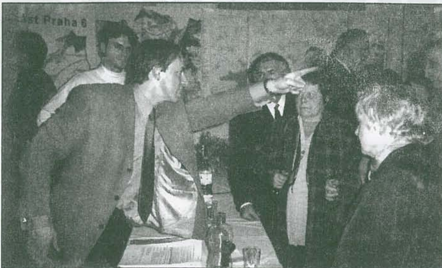
Na veřejném zasedání občanů konaném 17. 4. v aule kolejí Kajetánka v Břevnově představitelé m. č. Praha 6 předkládali výsledky své čtyřleté činnosti: opravené školy, domy, antisprejový program, udržované parky, hřiště a j. Problémy dopravy však vyvolávaly diskuse ještě po skončení schůze.