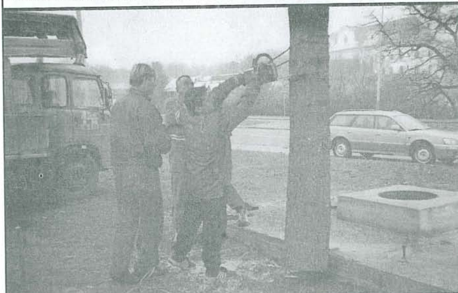
Firma Chládek přivedla z Bílé hory do Břevnova před klášter pěkný smrk. Kmen však byl příliš dlouhý a bylo nutné ho zkrátit. Je možné, že se tím vánoční strom zachrání před vyvrácením, neboť právě zde bývá povětrí dosti silné.