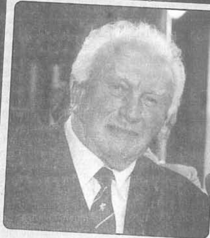
Dr. Zdeněk MAHLER – 75 let