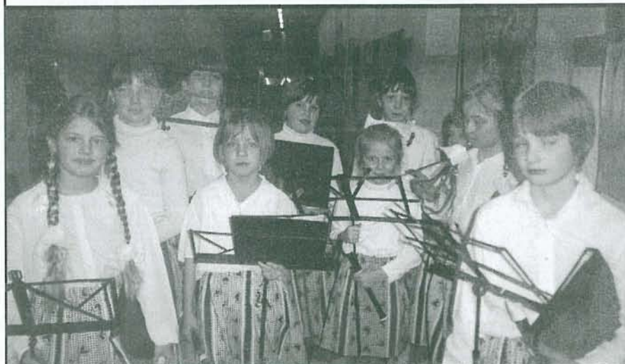
Na slavnosti 31. ledna v ZŠ Červený vrch, kdy se slavnostně otevírala zrekonstruovaná část školy, vystoupil Sedmihlásek a zdejší flétnový soubor k potěšení stovky diváků. Po slavnostních projevech čekalo pohoštění z nové školní kuchyně.