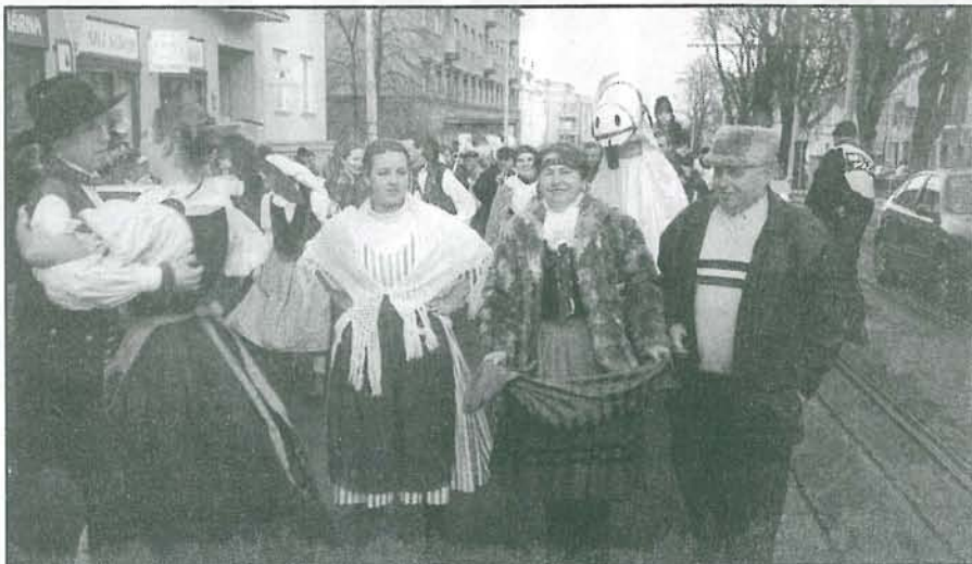
Stovky lidí se zúčastnili promenády letošního masopustu na Bělohorské ulici, přestože byly prázdniny a začínal víkend. Masopustní průvod se konal v pátek 4. února od poutní kaple U Zelené brány a skončil U Kaštanu, kde bylo občerstvení a pochována basa. Smuteční řeč přednesl převor P. Siostrzonek.