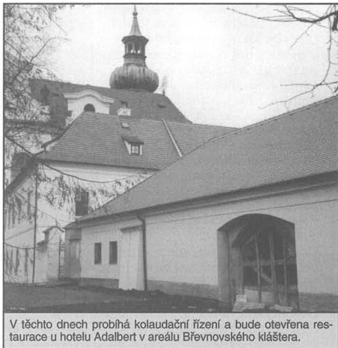
V těchto dnech probíhá kolaudační řízení a bude otevřena restaurace u hotelu Adalbert v areálu Břevnovského kláštera.

• Prodám chatu 36 m 2 u Kostelce nad Labem, pozemek 1200 m 2 , el., voda, plyn, tel., koupání v pískovnách, rybaření v tůních. Cena: 1 mil. 500 tisíc Kč. Tel.: večer – 220 511 227.