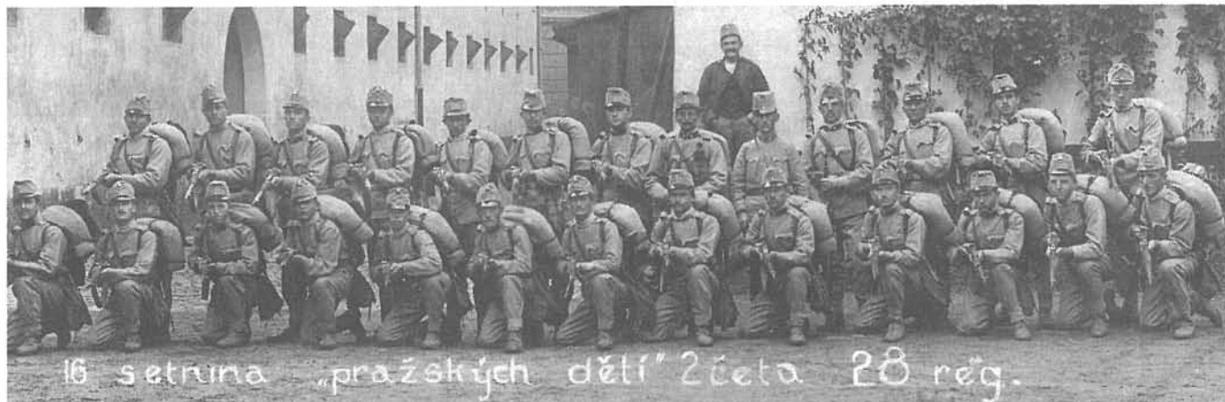
Část jedné pochodové formace Pražských dětí před odchodem na frontu počátkem války.

Začátkem letošního dubna uplynulo 90 let od vzniku legendy, jež se stala jedním z významných pilířů historie našeho odboje za první světové války – o přechodu pražského 28. pěšího pluku k Rusům. Tento z valné části vykonstruovaný příběh utrpěl během této dlouhé doby značné trhliny a šrámy, stále je však používán některými autory jako důkaz spontánní účasti českého národa při „bourání habsburského žaláře národů“. Lpění na nepravdivé legendě je podivnou součástí našeho obecného přístupu neschopnosti či nechtění poblédnou zpříma do vlastní nedávné minulosti.