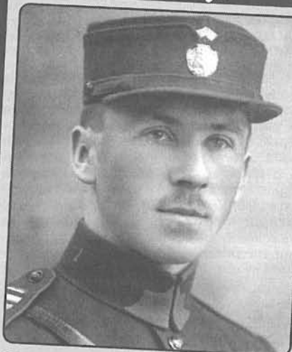
Generál Karel Kutlvaš