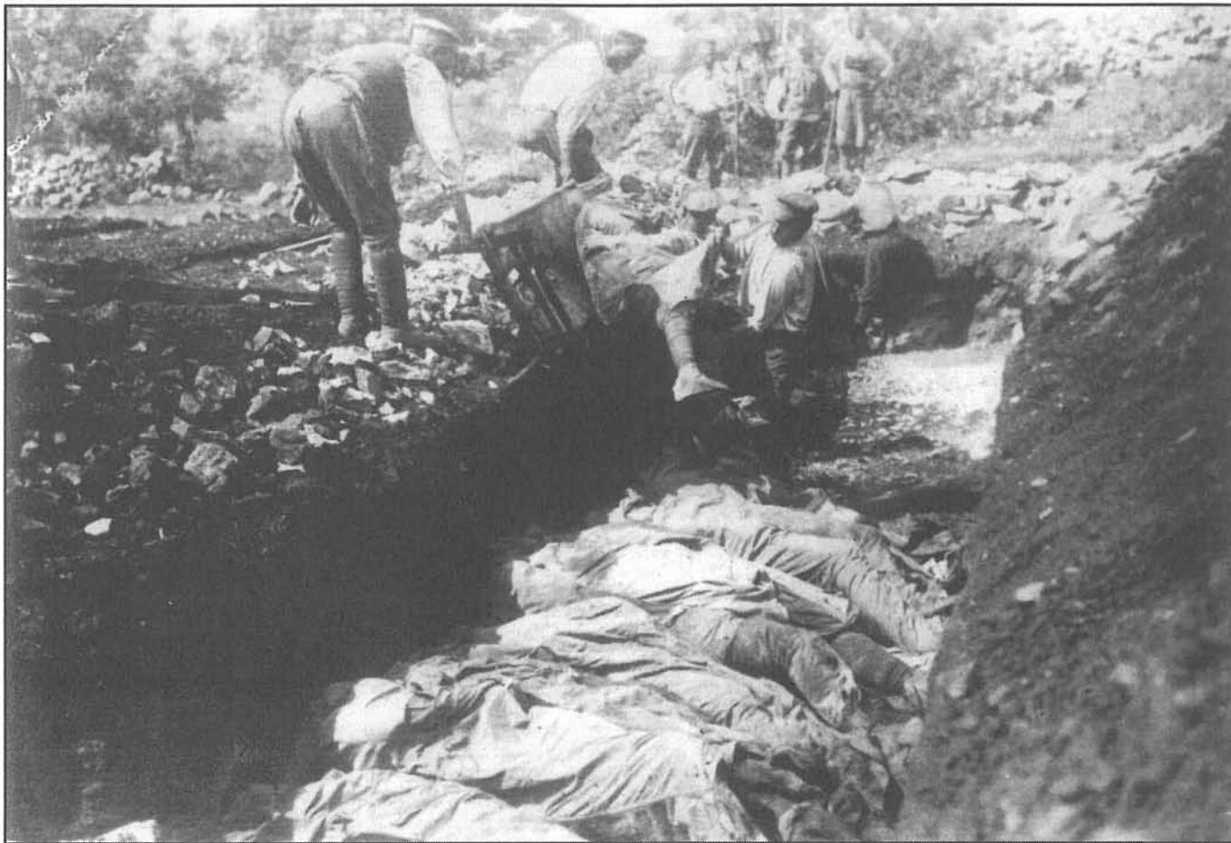
Pohřbívání našich vojáků ruskými válečnými zajatci v Haliči.

silně opotřebený 28. pěší pluk vystřídán a odešel do Gródku. Měl být po sedmi měsících nepřetržitého bojového zasazení na exponovaných úsecích fronty převeden do zálohy 4. armády, doplněn a vyslán k odpočinku. Tento záměr však padl hned příští den, kdy musel opět nastoupit cestu k frontě, kde vznikla kritická situace a AOK hledalo posily vem kde vem. Již počátkem březnových bojů v Karpatech soustředili Rusové zvláštní pozornost na styk 4. a 3. rakousko-uherské armády. Hranice mezi nimi vedla na čáře Regetów – Tylicz (sledovala zhruba průběh dnešní slovensko-polské státní hranice). Za ní ležela důležitá strategická severojižní komunikace vedoucí do nitra Uher. Tento důležitý prostor byl jen slabě obsazen, zejména ze strany pravé (jižní) 3. armády. Její pásmo bylo příliš široké a na zabezpečení křídel již nezbývalo sil. Rusové si nenechali tuto příležitost ujít a v noci na 25. března udeřili od Koniczné ke Zborovu (pozor – u východoslovenského Bardejova) na 28. pěší divizi, která byla krajním křídelním svazkem 3. armády.