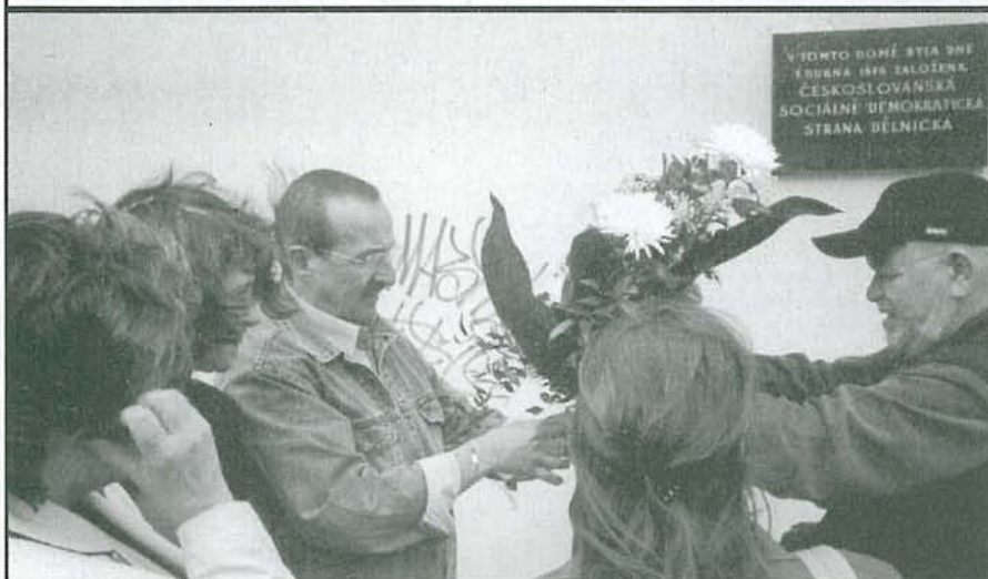
Větry dudy Bělohorskou ulicí, zdvihaly límcce, ofiny a odhozené papíry, ale sociální demokraté nezapomněli a přišli. Tak jako každý rok poslední léta kyticí na stěně Kaštanu připomněli, že zde 7. dubna 1878 založili stranu sociálně demokratickou. Je to nejstarší politická strana v Čechách.