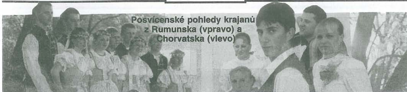
Posvícenské pohledy krajanů z Rumunska (vpravo) a Chorvatska (vlevo)