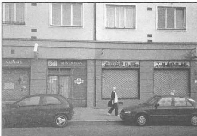
chod, kde se už vystřídala řada zájemců. Je velký 169 m 2 . Břevnováci, zkuste to...

• Rovněž schválena částka 300 tisíc korun jako příspěvek k vybavení denního stacionáře pro seniory v Domově důchodců v Šolínově