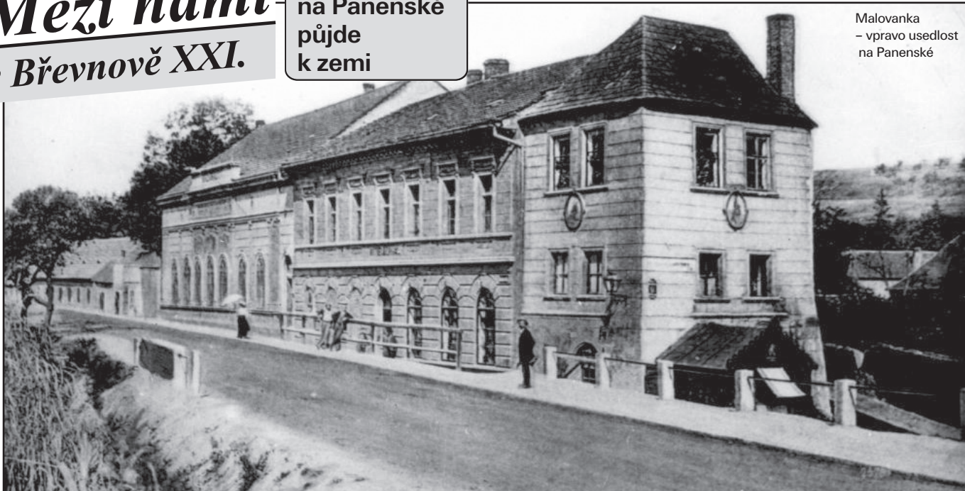
Malovanka – vpravo usedlost na Panenské

Viditelně, proti Strahovskému tunelu v Břevnově, se dosud nacházejí zbytky stavení, které již řadu let unikají pověstnému likvidačnímu buldozeru. Zachránit se už asi nedají, a jsou předmětem otázek a dohadů o jaké budovy se vlastně jedná.