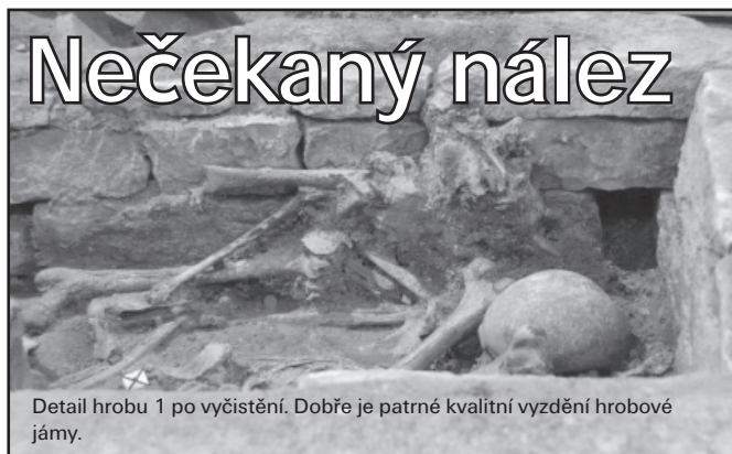
Detail hrobu 1 po vyčištění. Dobře je patrné kvalitní vyzdění hrobové jámy.

Většina návštěvníků Břevnova neopomene navštívit zdejší slavný benediktinský klášter, a alespoň část z nich využije možnost a podívá se i do jeho dnešního podzemí. Navštíví románskou kryptu, jednu z nejkrásnějších a nejpůsobivějších památek románského umění v Čechách. Krypta byla objevena archeologickým výzkumem v šedesátých letech minulého století, poté byla restaurována a zpřístupněna. V odborné veřejnosti panuje shoda, že krypta musela být vystavěna už někdy před rokem 1045. Poměrně bezpečně totiž víme, že tehdy byl v kostele pohřben známý poustevník Vintř, takže alespoň jeho východní partie musela už být dokončena. Po provedeném výzkumu by se mohlo zdát, že prozkoumaná památka už vydala všechna svá tajemství. Že tomu tak zdaleka nemusí být, se ukázalo v loňském roce. Tehdy byla provedena revize stavu krypty i u ní umístěné stálé expozice výsledků výzkumu. Součástí expozice byly i tři hrobky odkryté někdejšími výkopovými pracemi v těsné blízkosti kostelní krypty. V hrobech dosud ležely původní kostrové pozůstatky.