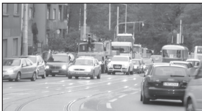
Nesrovnatelný je provoz na Hládkově dnes a v 60 letech minulého století jak lze vidět na horním snímku s benzínovou pumpou.