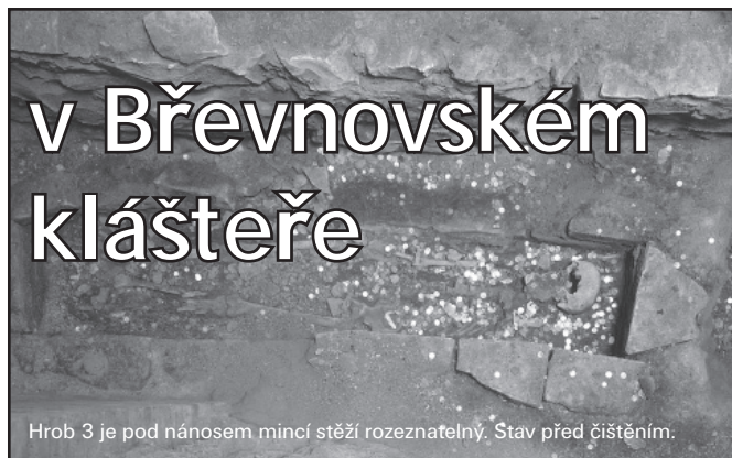
Hrob 3 je pod nánosem mincí stěží rozeznatelný. Stav před čištěním.

ky zkoumány. Velkým překvapením byl nález učiněný při vyzvedávání hrobu 3. Kostra v něm ležela v orientované poloze (tj. východ - západ) na zádech, paže natažené podél těla. V místech pravé dlaně byla nalezena hrouda tvarem připomínající minci, která snad byla podle několika náznaků jemných vláken původně zabalená do tkaniny (?). Při čištění nálezu v laboratoři Národního památkového ústavu se ukázalo, že se jedná o 3 spleené denáry. Ty se zatím z obavy, aby nedošlo k jejich poškození, dosud nepodařilo od sebe oddělit. Proto jsou zatím určeny pouze mince krajní. Obě byly raženy za druhé vlády knížete Vladislava I. mezi lety 1120 až 1125. Tato skutečnost je zásadní pro datování popisovaných hrobů, kostry musely být uloženy do země někdy po datu, kdy byly obě mince vyraženy. Jak dlouhé bylo toto časové prodloužení, samozřejmě bezpečně nevíme, ale dobrý stav mincí naznačuje, že než se dostaly do země, nebyly snad v oběhu dlouho. Předpokládáme, že se tak stalo ještě někdy v průběhu 12. století.