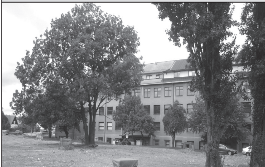
Rekonstrukce budov ve vojenské nemocnici pokračuje. Byly zbourány prastaré ubytovny, plac po nich se zplanýroval a najednou se vyloupila do uvolněného prostranství skupina krásných vzrostlých topolů, až se dech tají. Doufáme, že další stavební práce stromy přežijí a že je vojáci nevezmou útokem.