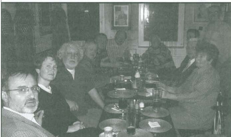
Podtrženo, sečteno, ukončeno. 13. listopadu se sešla úředně a naposledy kulturní komise m.č. Praha 6, která pracovala ve volebním období 2002 - 2006. Její poslední schůzování se odbyvalo v restauraci U Prezidentů v Břevnově a stoly byly vytvořeny ze starých šicích strojů. V jakém složení bude pracovat komise nová i komise jiné, rozhodne m.č. v těchto dnech.