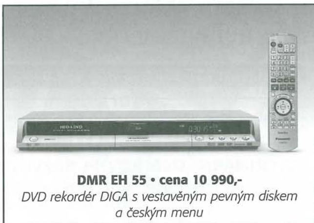
DMR EH 55 • cena 10 990,- DVD rekordér DIGA s vestavěným pevným diskem a českým menu

V měsíci prosinci otevřeno So – Ne 9.00 – 17.00 hod.