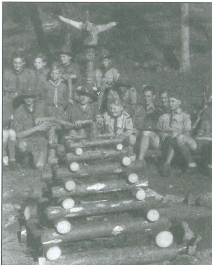
Kampak se asi poděl totom skautského oddílu Ilja? Jejich klukovská kronika a vůbec jeho členové?