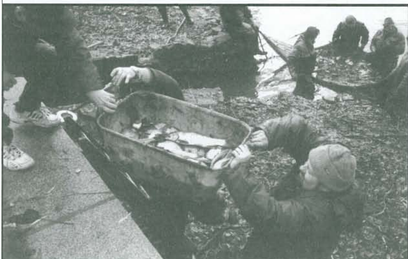
Při výlovu Pivovarského rybníka byly vytaženy krásné kusy ryb. Také jedna občanka, lahvové pivo a samička ráčka. Ihned přiletěli od řeky rackové, kteří vědí o každém výlovu. S množstvím ryb byli rybáři spokojeni. My se ale těšíme na rybářskou prezentaci při oslavách stého výročí Břevnova v dubnu příštího roku.