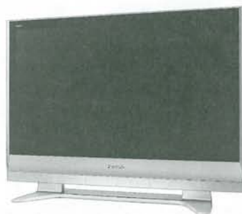
TH 42 PV 60 • cena 39 990,- Plazmový televizor VIERA s vysokým rozlišením a úhlopříčkou 106 cm

Přejeme našim zákazníkům vše nejlepší a úspěšný rok