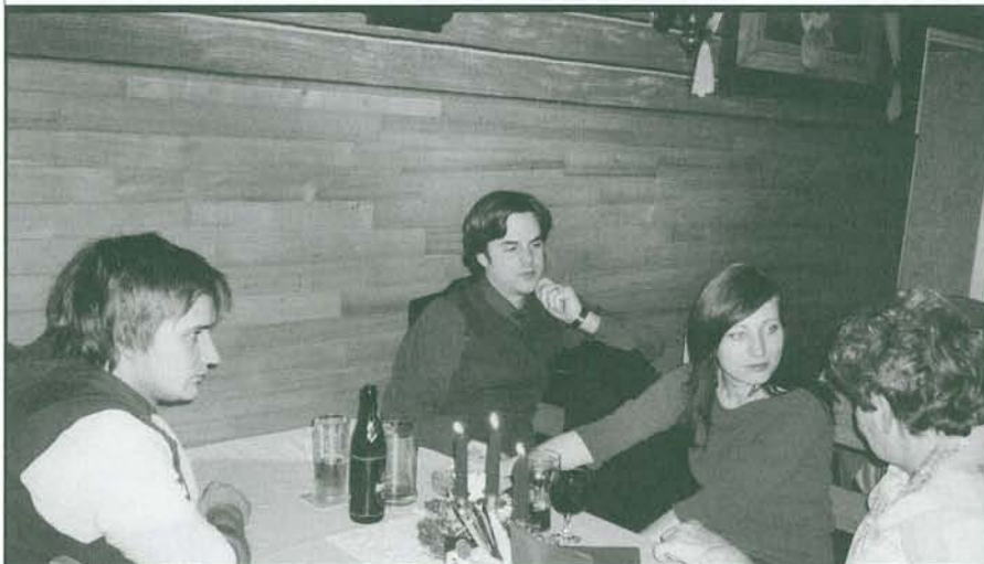
Na společenském večíрку spolku živnostníků v Břevnově v salonu restaurace Markéta v Radimově ulici se sešlo i několik nových mladých členů organizace. Večírek se konal v závěru loňského roku.