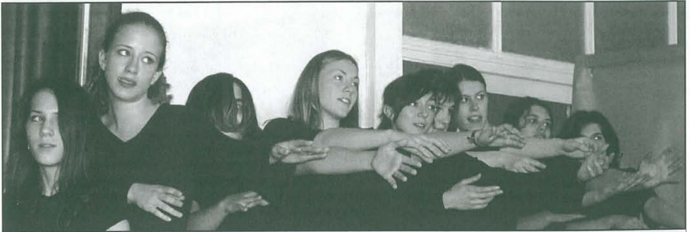
V gymnáziu na Petřínách mají k divadlu a muzikálu vždy velmi blízko k potěšení svému a stovek diváků. Někteří si možná vzpomenou na předloňský úspěšný muzikál „Byl jednou jeden král“ uvedený k výročí školy a který byl rovněž představen na našem posvícení.

Elektronuniversal, Bělohorská 122, 128, 147 Břevnov