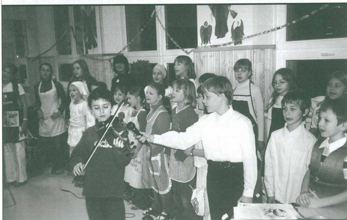
Tolik dětí – jako smetí – věnuje se hudbě v Břevnově a také se umí představit, zahrát a zaspívat. Škola s rozšířenou jazykovou výukou Pod Marjánkou při slavnostním otevření nové jídelny pozvala rodiče a veřejnost, děti zaspívaly a pak se hezky pěkně najedly.