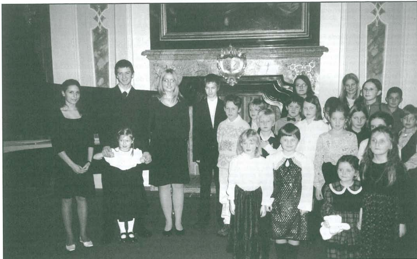
Děti břevnovské farnosti se představují v Tereziánském sále průběžně a rádi. Ostatně, zde se pořad hraje a zpívá.