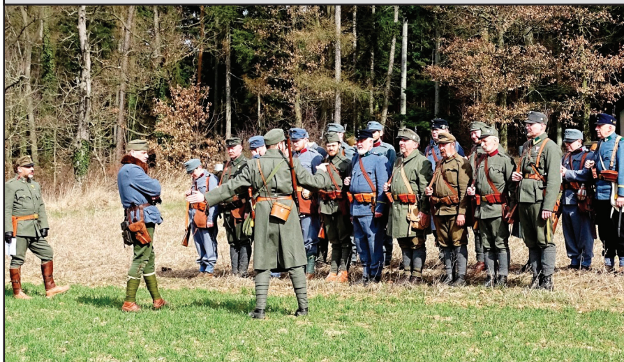
Členové klubu vojenské historie od osmého pluku zeměbranceckého z Pohořelce při pořadovém výcviku v areálu přírody v letošní sezóně. Nesmí chybět dobová výstroj, flinty, patronašky, onuce atd. Čeká je řada akcí, jak oznamuje zpráva, Co nového u pluku.