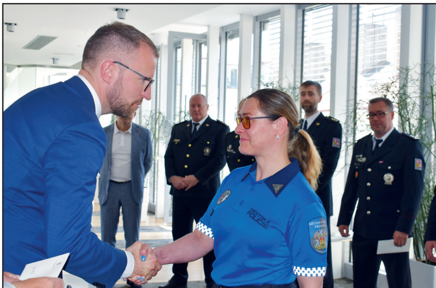
V těchto dnech bylo pozváno do úřadu MČ Praha 6 starostou Jakubem Stárkem několik vybraných policistů, hasičů a městských strážníků, aby přijali poděkování za spolehlivou službu v Praze 6 a byli odměněni jednorázovou částkou deset tisíc korun. Děje se tak u nás každý rok.