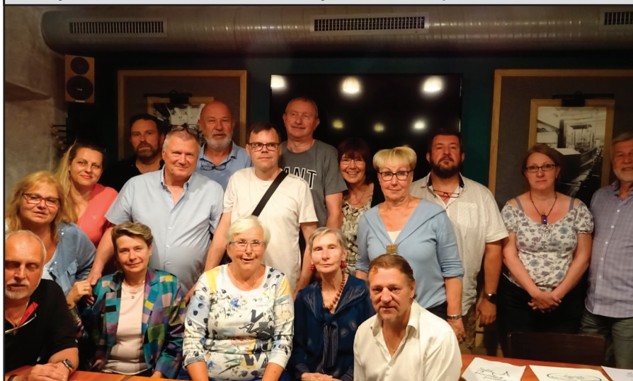
7. června 2023 konala se v restauraci U Bílého lva výroční valná hromada živnostenského spolku v Břevnově. V referátu o činnosti v poslední době zmíněn pochvalně letošní masopust, čarodějnice a 1. Pivní máj, které spolek pořádá již řadu let. Jen maskární bály v dohledné době zřejmě nebudou pro malou účast a velkou drahotu.