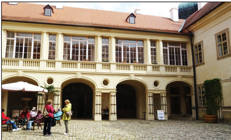
Ke společenské události letošního jara patřil také výlet Břevnováků do Mníšku pod Brdy a na Skalku, který se uskutečnil 20. května. Cílem těchto jarních a podzimních výletů je navštívit okolí Prahy, které je krásné a blízké ve všech směrech. Po posvícení má být tradiční podzimní výlet. Na snímku výletníci na nádvoří zámku.