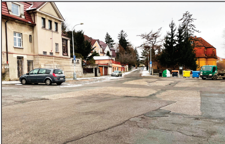
Náměstíčka v oblasti Malého Vatikánu v Břevnově se dostala do pozornosti úřadů. Hned se našly návrhy na vylepšení prázdného místa, ale při diskusích s občany zjištěno, že toho lidé v těchto poklidných místech zas tolik nechtějí. Shoda se našla na vybudování podzemních kontejnerů. Při letním pohledu na fotku jest však jisté, že by to chtělo plácky hezky vydláždít a řádně opravit okolní silnice, aby byly rovné a bez děr.