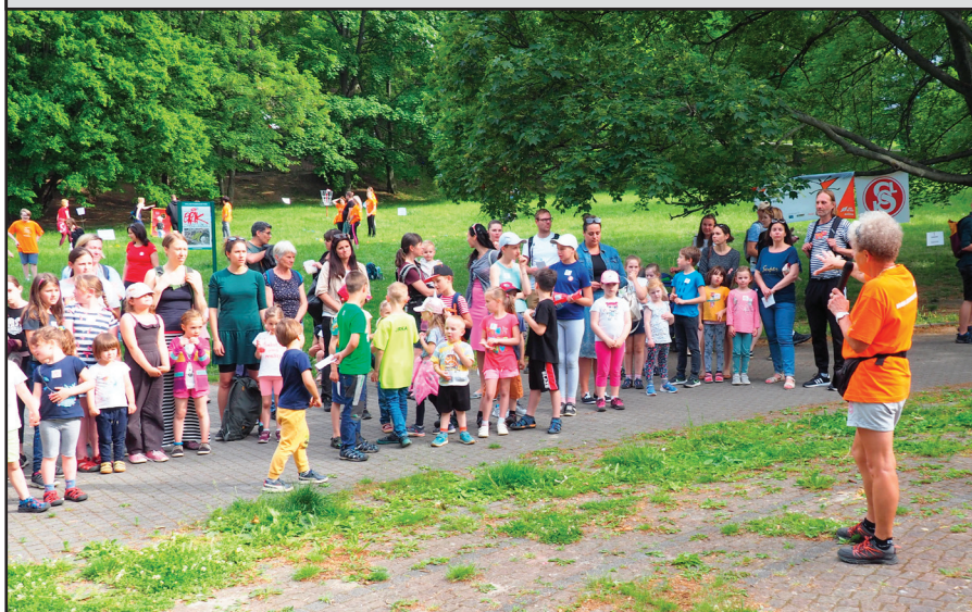
27. května se konal v Břevnově opět úspěšný sokolský dětský den za účasti sokolů a jejich rodičů. Počasí bylo příjemné, radost dětí z pohybu byl jistě pro organizátory potěšující.

šarvátkách mezi císařskými a stavovskými vojsky – až po rozhodující bitvu dne 8. listopadu 1620. Hovořila i o bojové morálce i taktice zneprátených stran a o překvapivém vývoji bitvy směřující k totální porážce stavovských armád spojenými vojsky vojevůdců Tilly–ho a Buquoye. Po komentované prohlídce areálu se účastníci sešli u tábora v místní klášterní zahradě. Mezi pozvanými hosty byl i radní 6. pražské městské části MUDr. Marián Hošek.