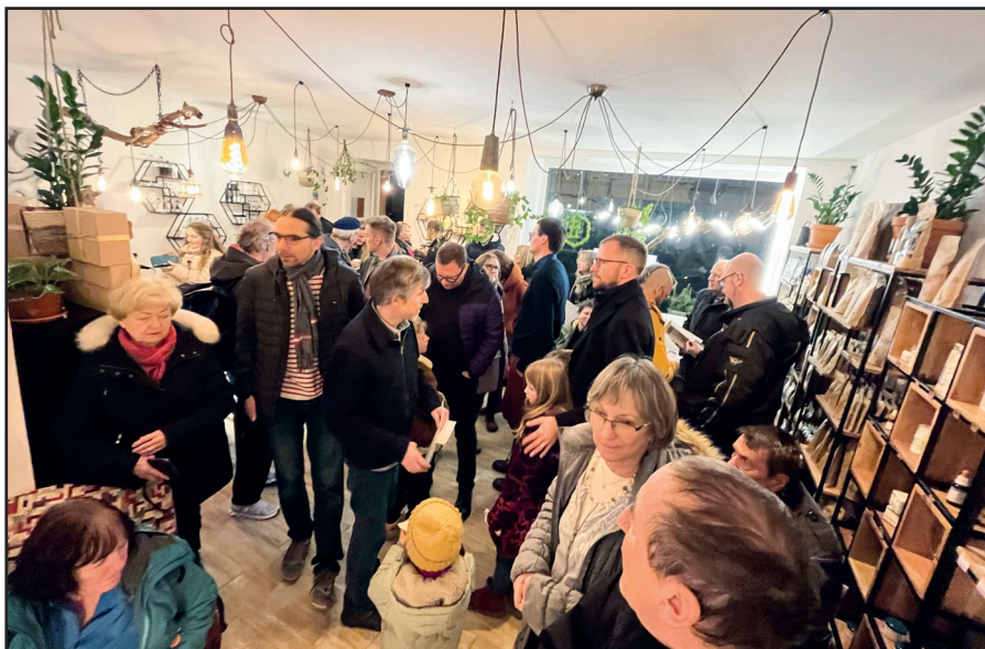
Sousedská atmosféra panovala 22. února v obchodě Pollesí na Bělohorské 89, kde se uskutečnila vernisáž známého obrazu Malí cukráři a jejich velký dort. Někteří čekali raději venku, aby nevznikl nával. Akce se povedla.