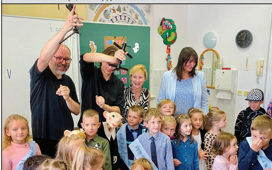
Nedávná návštěva Spejbla a Hurvínka v ZŠ Jana Amose Komenského v Břevnově vyvolala u prvňáčků veselou náladu. Jenže nedávno... to byl začátek školního roku a dnes už možná leckdo myslí na blížící se letní prázdniny. O této zajímavé základní škole se blíže dočtete na straně 9.

– 9.30 – 19.00 hod., a to v parku Maxe van der Stoela. Akci pořádá – skupina historického a scénického šermu Allgor – www.allgor.cz Již po druhé se udatní rytíři království českého utkají ve velkolepých turnajích a neúprosných soubojích na posvátném místě Hradčanech.