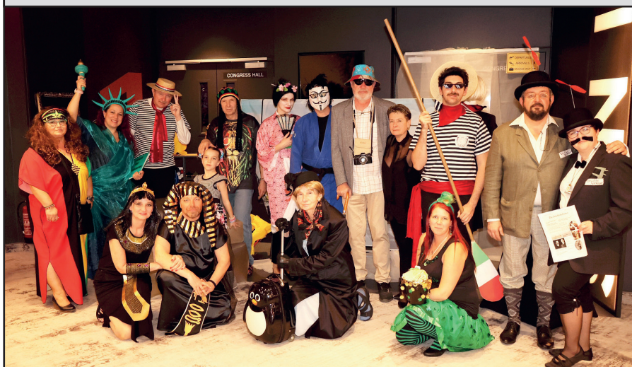
9. března 2024 proběhl v hotelu Pyramida maškarní živnostenský bál s velkým množstvím rozdívných masek. Nevešly se ani do společného fotografování, takže jsme s lítostí museli k otěštění zvolit menší variantu. Zato spokojeni byli účastníci, hudba dobře hrála, živnostenská tombola byla obrovská. Ráz pro letošní bál byl "Letem světem". – Tak zase příště!